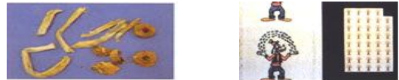
4. 麻薬 (マジックマッシュルーム) 5. LSD (アシッドなど)