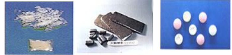
1. 覚せい剤 (エス、スピードなど) 2. 大麻樹脂 (マリファナ、ハッピーなど) 3. 麻薬 (MDMA) (エクスタシーなど)

乱用される薬物には、覚せい剤、大麻（マリファナ）、コカイン、ヘロイン、あへん、MDMA、マジックマッシュルーム、LSD、シンナー・トルエン（有機溶剤）などがあります。