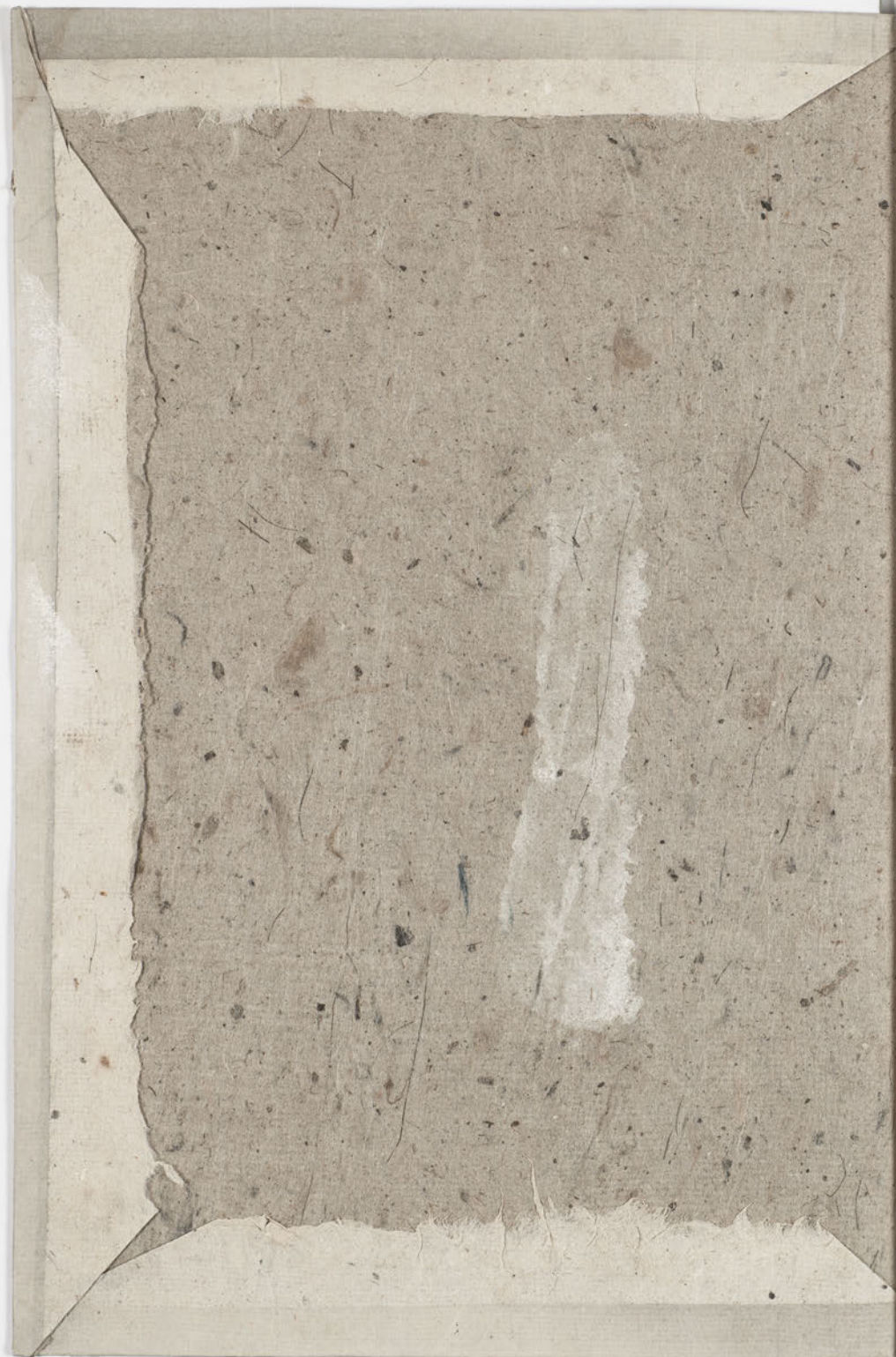
『浄土十勝箋節論』卷上・乾上