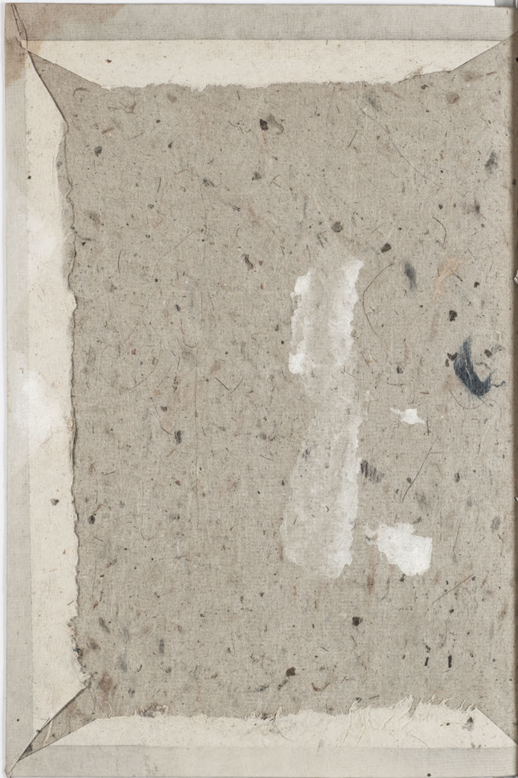
『浄土十勝論輔助義』第二