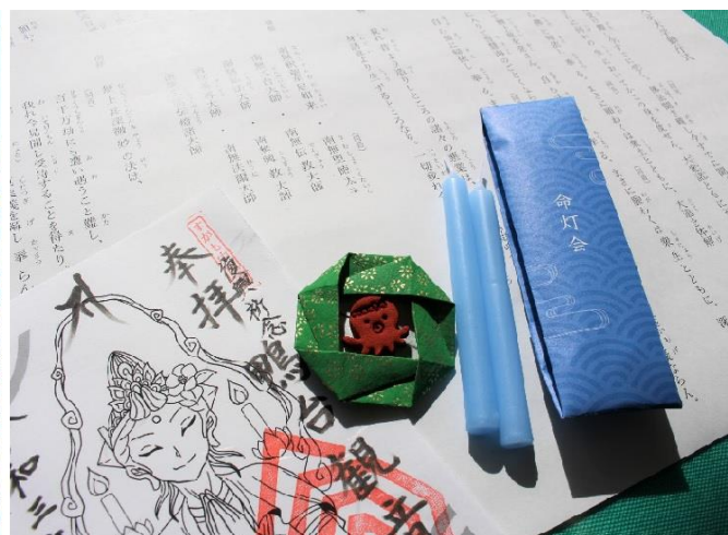
事前申し込み者(先着100名)に郵送される追悼キット