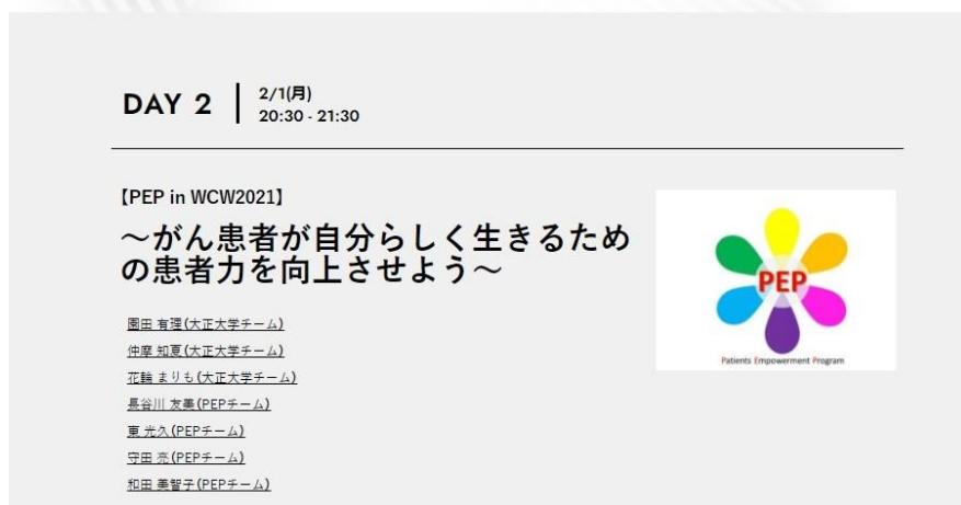
World Cancer Week 2021 登壇回プログラム画像