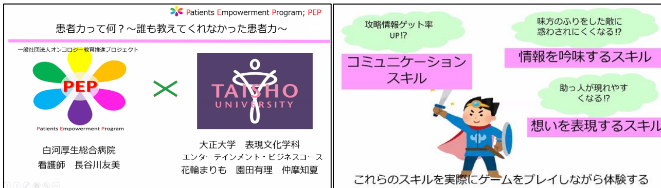
防ごう! 医療崩壊! 患者力向上 PR 企画概要