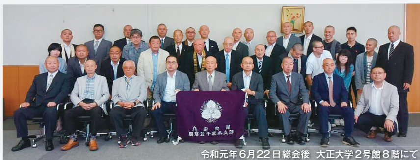
令和元年6月22日総会後 大正大学2号館8階にて

新しくなりました新8号館を中心に大正大学の大学施設見学（キャンパスツアー）を行います。