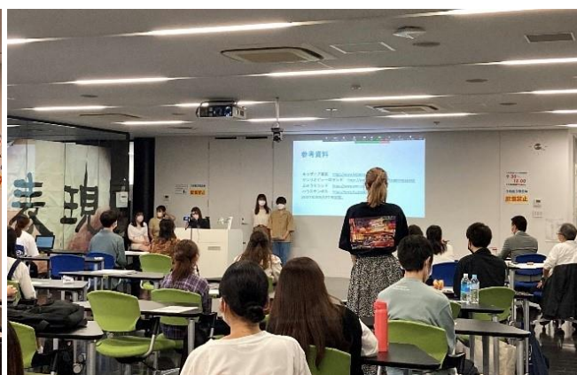
公開授業収録時の様子②（10月11日）