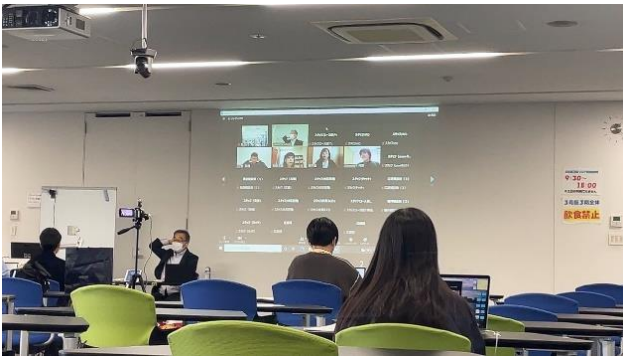
映像祭 2021 1 日目の様子(11 月 6 日)

プロジェクトの集大成となる「映像祭 2021」を11月6日、7日に本学学園祭「鴨台祭」のアカデミック企画として実施し、当日の様子を本学公式 YouTube チャンネルにて期間限定（※）で公開開始しました。コロナ禍で、オンラインによる映像祭初開催となり不安もある中、学生が一から企画・運営を行った「映像祭 2021」の集大成をぜひご視聴ください。