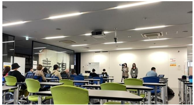
映像祭 2021 2 日目の様子(11 月 7 日)

■YouTube 情報（※）動画配信期間は 2021 年 12 月 5 日（日）までの予定