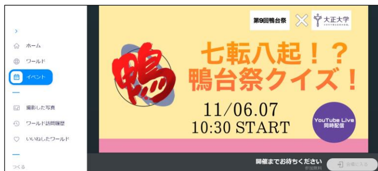
↑ Cluster 内での告知画像

鴨台祭の実施日である 2021 年 11 月 6 日・7 日の 2 日間ともに、VR 空間内での企画・運営を鴨台祭実行委員が担当しています。当日は、鴨台祭にまつわるクイズを進めながら、チャット機能で寄せられる疑問・質問などに柔軟に回答し、双方向のコミュニケーションを目指します。