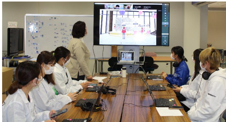
↑ バーチャルキャンパス内でのクイズ大会に備え、リハーサルをする実行委員の様子