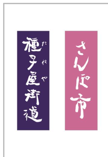
「中山道 種子屋街道さんぽ市」ポスター裏