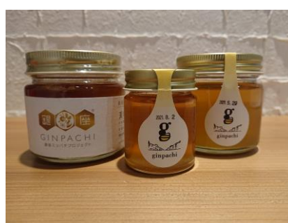
銀座ミツバチプロジェクトより、 「50g」と「150g」のはちみつを販売します！