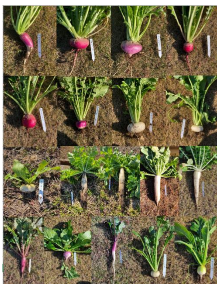
「お茶屋」ブースで全国各地の伝統野菜を提供予定 (上記の伝統野菜をお漬物にします)

★江戸野菜種プレゼント…先着 200 名様に「ごせき晩成小松菜」の種子プレゼント（日本農林社提供）