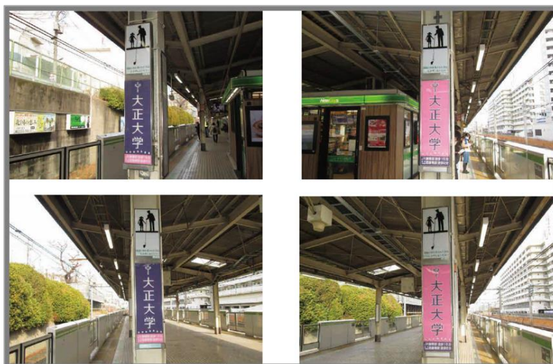
JR 山手線 巣鴨駅ホームのマジックハンド掲出柱の様子