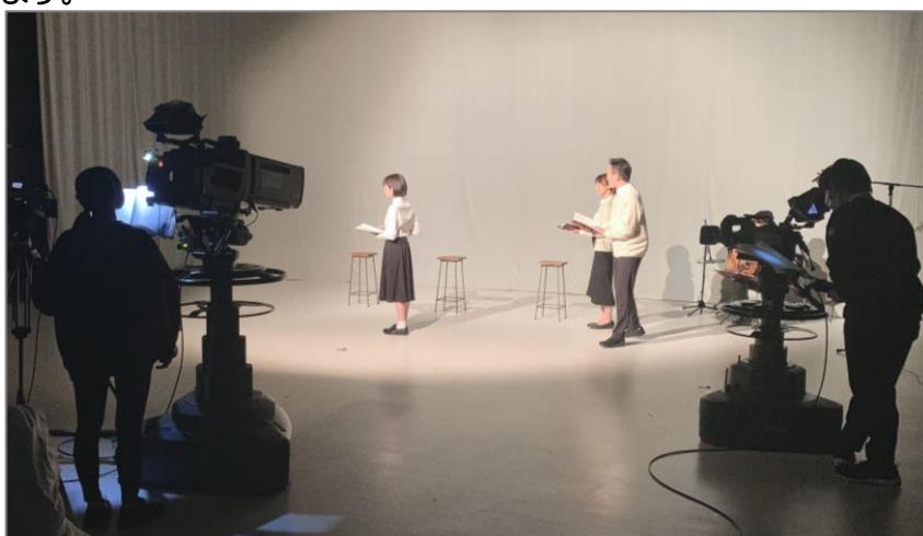
左：豊島区×家族草子×大正大学×としまテレビ共同プロジェクト「イキヌクキセキ」ポスター 上：家族草子「イキヌクキセキ」収録風景