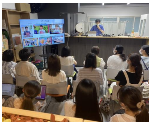
SNS の情報プロモーション手法を学ぶ様子

当日は「しずおか葵プレミアム AWARD※3」として認証されている商品を店頭と並べる他、その中から厳選した 4 商品のプロモーションを学生が行います。また、公式 YouTube チャンネルにて食材の美味しい調理法を学生自ら実演する「ライブキッチン」の配信を行うなど、これまでの学びを活かした多彩な方法で地域の魅力を発信します。報道関係者の皆様からの取材依頼をお待ちしています。