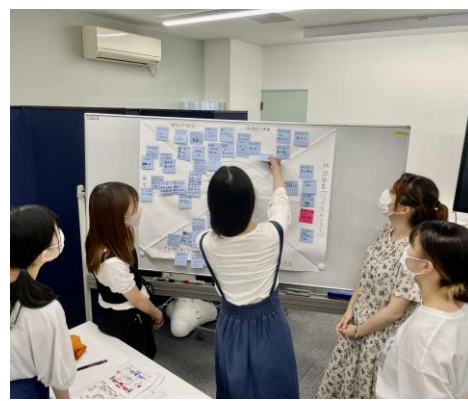
ディスカッションやグループワークを通して、プレゼンテーション力、コミュニケーションスキルを養成