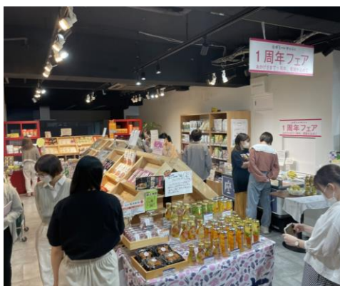
ガモールマルシェ 1 周年フェアの様子