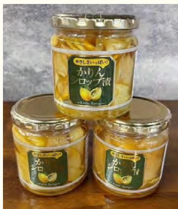
かりんシロップ漬け

現在、地域創生学科が地域実習などでお世話になっている 長野県箕輪町・岐阜県飛騨市 の商品をご用意しております！