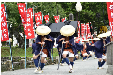
神輿渡御行列実行委員会 「傘回（かさまわし）」