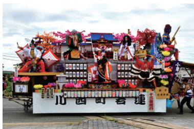
川西町若連・小泉囃子若連 風流「暫（しばらく）」