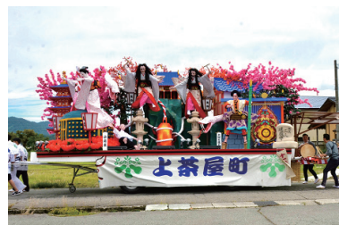
上茶屋町若連・松本囃子若連 風流「二人道成寺（ににんどうじょうじ）」