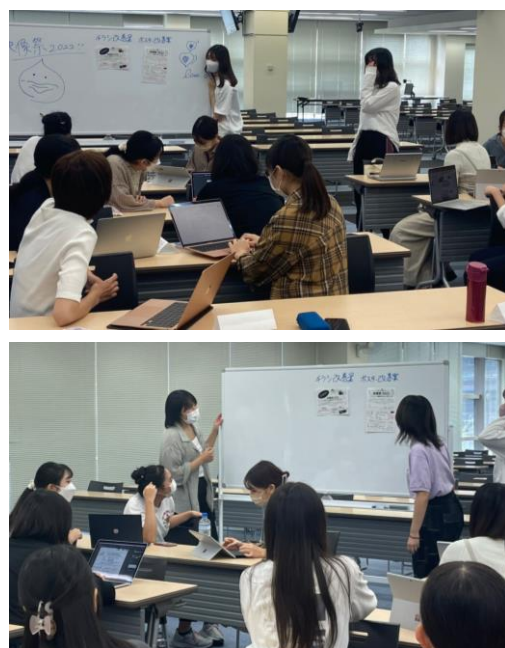
映像祭 2022 の準備の様子