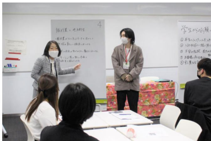
LADY JATA 委員会の皆様にフィードバックをいただきながら参加者全員に向けて発表をおこないました