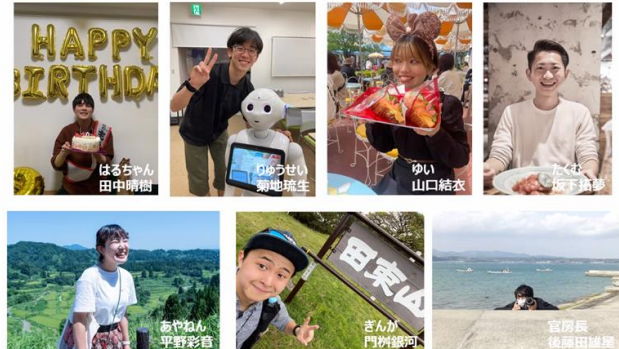
ファシリテーターを務めた地域創生学科の学生紹介スライド