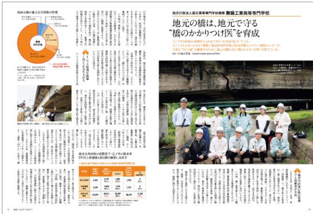
舞鶴工業高専「e+iMeC」の講習会。全国から高専生が集まり橋を調査する。