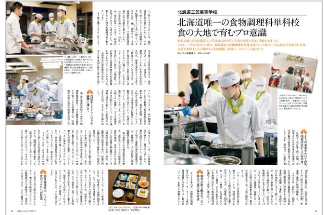
開校が決まった三笠高校は、北海道で唯一の食物調理科単科校として再生した。