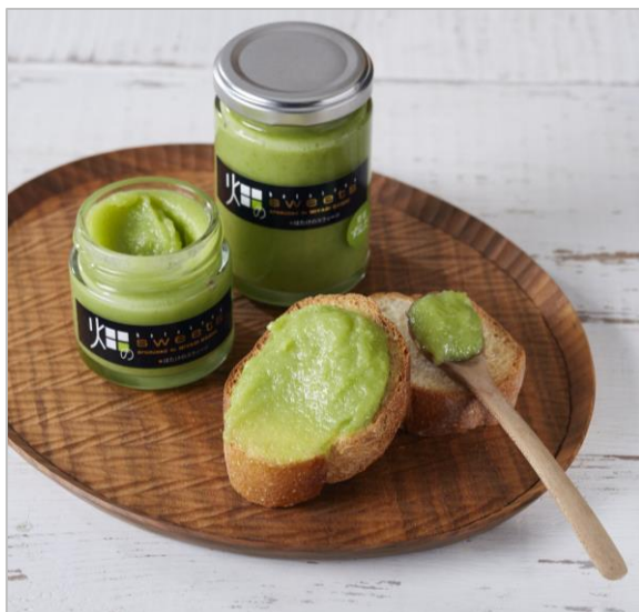
くりはら生ジャム「すんだ」(有)パレット)