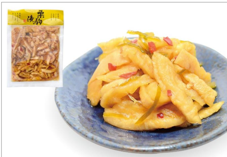
栗駒漬「ピリ辛うま大根」((株)二上)