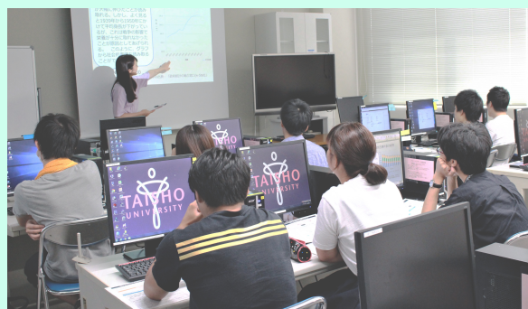
人間科学科の授業一覧