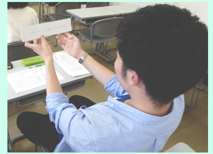
授業内での実験の様子

心理学実験基礎演習では、心理学に関する実験や調査を実地で学び、自らデータを記録し分析したり、その結果をレポートに報告するといったことを行います。つまり、心理学の研究で実際に行われていることを学生自身がコンパクトな形で体験することを目的とした授業です。心理学を専門的に学ぶことができる大学では、このような形で実験や調査のしかたを学ぶことのできる科目を用意していることがふつうです。同様の科目は、認定心理士という学部レベルの心理学の基礎資格の取得にも必要とされています。つまり、大学において心理学を専門的に学んだと言えるためには、上に述べたような研究のプロセスについて学んでおり、それをある程度実践できることが求められるということです。実験や調査を自分たちで行ってみることで心理学全般に関する学びを深めることができます。教科書に書いてあったことは何となく理解したつもりになっていても、実際にやってみると全然わかっていなかったことに気づくことができます。また、データをどのように収集し分析するのかを知ることによって、教科書に掲載されているグラフがどのように作成されるのかがわかり、より実感を持ってそれらの内容を理解することができるようになります。何より、心理学の実験や調査に参加者として協力することは心理学関連の学科に所属していなくても募集があれば可能です。学生の皆さん自身が実験者となること、さらには、実験や調査の報告者となることは、心理学関連の演習授業を履修する以外の手段では難しいと思います。心理学関連の演習授業の基礎として重要な位置づけを担う科目です。