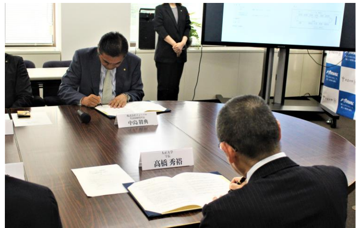
協定書への署名をおこなう様子

本協定は、地域戦略人材の育成を目指す本学に対して、DX やグリーントランスフォーメーション（以下、GX）を進める人材確保に力を入れて地域の企業・行政を下支えするコンサルティング活動を展開する同社より、「人材育成及びフィールドの提供を通じた共同」の申し出があり、実現に至りました。