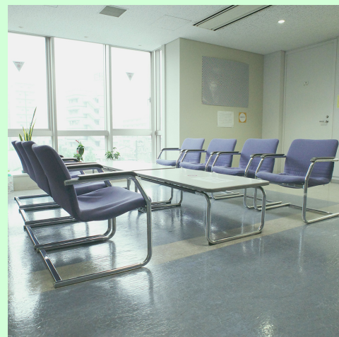
2号館4階のミーティングスペース

また、2号館の4階と5階にはミーティングスペースがあり、学生と教員が面談を行ったり、授業の空き時間には学生同士で談話したりしています。