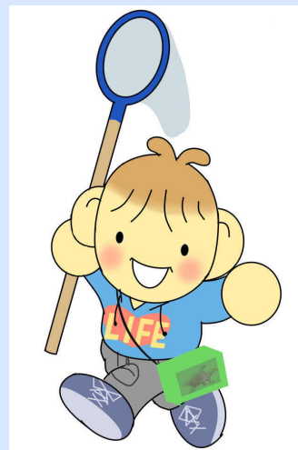
学科キャラクター『らいふみる』くん

学科の学びに関する情報は、第1号から第3号の『らいふみる』も参考にしてください。学科ブログに掲載されています。