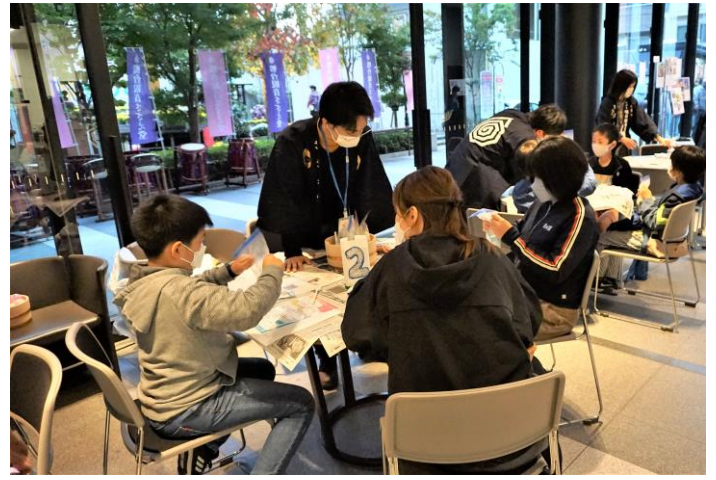
2022 年度イベントの様子

本学の位置する巣鴨の地は、江戸時代から戦前までの間、旧中山道を巣鴨から北上した所から滝野川三軒家（現：北区滝野川六丁目）の間が「種子屋通り」と呼ばれるほどの種苗販売街だった歴史があります。