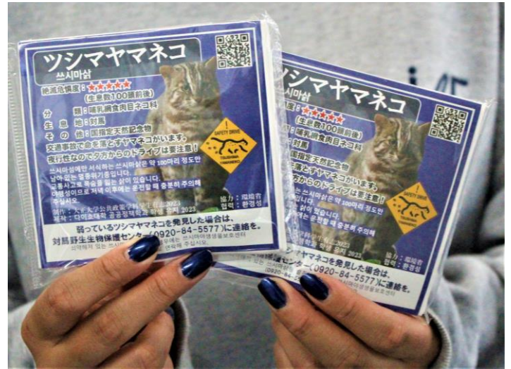
9月に学生が手作りしたドライバーへの注意喚起のための看板（左）と「ヤマネコ祭 2023」当日に配布する学生によるデザインのポケットティッシュ（右）

当学科では毎年、環境社会学や環境教育論などを学んでいる学生が長崎県対馬市に赴き、絶滅危惧種及び対馬固有種であるツシマヤマネコの保護活動に取り組んでいます。