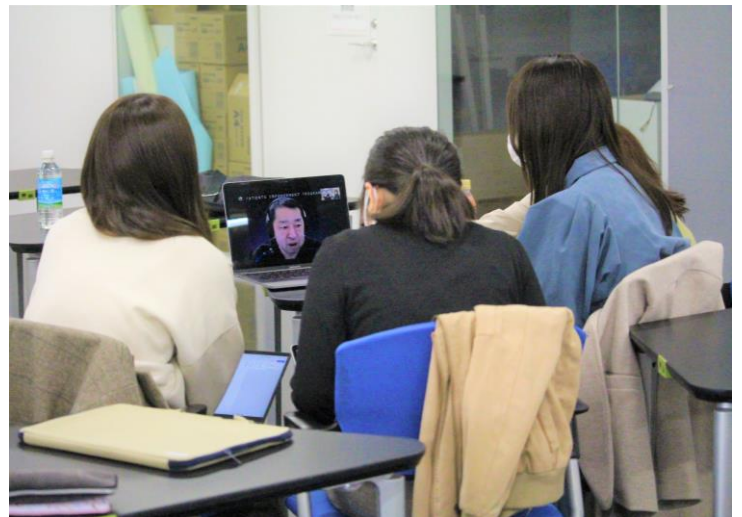
第1回目の授業では企業・団体の皆様にオンラインで参加いただきお話を伺いました

PEPが設けた課題は、子どもが病気になった際、または育児中に親自身が病気になった際に、親が医療従事者より身近に相談できる場所や仕組みをつくること。