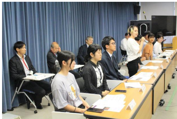
2023年8月3日に実施の文部科学省での記者会見の様子

※1 公益財団法人日本離島センター…全国 136 の離島関係市町村で組織。1966 年の設立以来、離島に関する調査研究の実施並びに提言、講演会・研修会などの開催、広報誌その他図書の刊行・配布、情報発信イベントの開催、資料の整備及び公開、島づくり活動に対する助成などの事業を行っている。2021 年 12 月、持続力ある離島地域社会の発展と人材の育成を目指し、大正大学と連携協定を締結した。