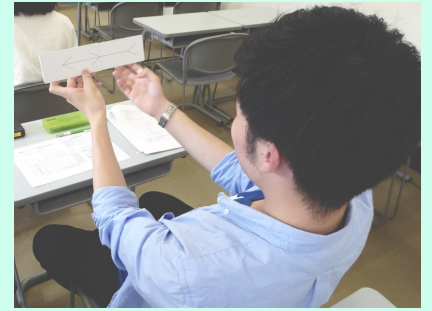
授業内での実験の様子

心理学実験基礎演習では、心理学に関する実験や調査を実地で学び、自らデータを記録し分析したり、その結果をレポートに報告するといったことを行います。つまり、心理学の研究で実際に行われていることを学生自身がコンパクトな形で体験することを目的とした授業です。心理学を専門的に学ぶことができる大学では、このような形で実験や調査のしかたを学ぶことのできる科目を用意していることがふつうです。同様の科目は、認定心理士という学部レベルの心理学の基礎資格の取得にも必要とされています。つまり、大学において心理学を専門的に学んだと言えるためには、上に述べたような研究のプロセスについて学んでおり、それをある程度実践できることが求められるということです。実験や調査を自分たちで行ってみることで心理学全般に関する学びを深めることができます。教科書に書いてあったことは何となく理解したつもりになっていても、実際にやってみると全然わかっていなかったことに気づくことができます。また、データをどのように収集し分析するのかを知ることによって、教科書に掲載されているグラフがどのように作成されるのかがわかり、より実感を持ってそれらの内容を理解することができるようになります。何より、心理学の実験や調査に参加者として協力することは心理学関連の学科に所属していなくても募集があれば可能ですが、学生の皆さん自身が実験者となること、さらには、実験や調査の報告者となることは、心理学関連の演習授業を履修する以外の手段では難しいと思います。心理学関連の演習授業の基礎として重要な位置づけを担う科目です。