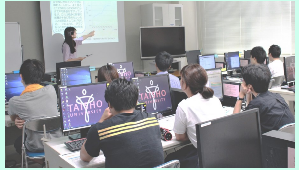
人間科学科の授業一覧

3年次に履修する「人間科学専門演習」では、少人数のゼミで特定の研究領域を深く学んでいきます。「卒業論文」は、4年次に履修する単位であり、人間科学科における4年間の学びの総まとめとして、自分で選んだテーマについて独自の問いを立てて、教員の指導を受けながら自分で実験や調査を行い、その成果を論文にまとめます。Lifeに関わることならどんなことでもテーマにすることができるのは人間科学科の卒業論文の特徴といえるでしょう。