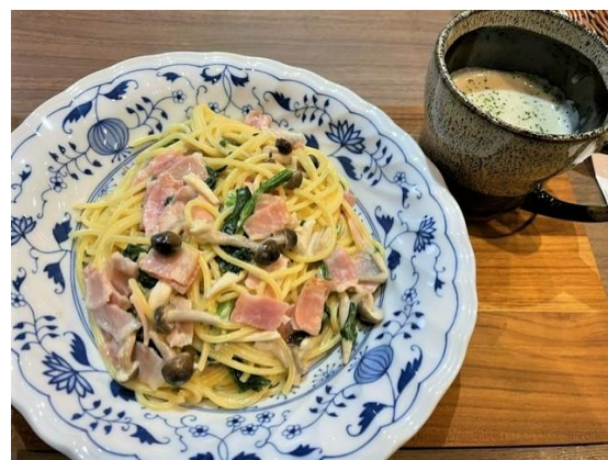
『ガモール堂』の看板商品であるスムージー（左）と新商品セットメニューの Pasta（写真右上及び右下）