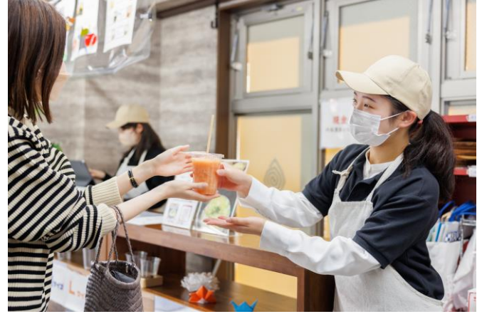
移転前の店内の様子

形が悪く取り扱いが難しい果物や野菜などを店舗で使用することにより、2021年の当店舗オープンから現在までで約530キログラムのフードロスを防ぐことができました。引き続きさらなるフードロスの削減を目指すため、新メニュー開発にあたっては、それらの野菜・果物を使用してソースを開発。セットメニューのパスタに使用し、ご提供します。