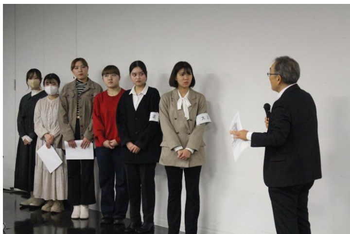
昨年度に開催した当イベントの様子