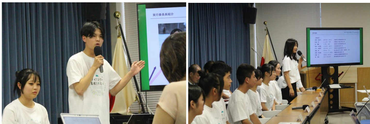
2024年8月2日に行った文部科学省での記者発表の様子

2023年度の本格開催に続き2回目の開催となる今年度のテーマは「合縁島縁（あいえんとうえん）～つなげよう、つながろう、私たちの離島～」。地理・年齢・立場の垣根を超えて「離島」という#（ハッシュタグ）でつながることで、日本全国の離島の持続可能な未来をともに考え、実践していくきっかけや支えとなる「アイランダーコミュニティ」を創りたいという思いが込められています。