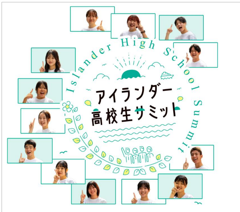
アイランダー高校生サミットのロゴマークと今年度実行委員の大学生及び高校生

当サミットの対象者は全国の離島に住む高校生、離島に所在する高校に通う生徒等です。本学の教員や学生、さらには前回のサミットに参加した高校生等が実行委員として運営を担う本イベントでは、島での生活や高校での学習を通して発見した島の魅力や課題などを参加者同士が学び合い、アイデアを出し合うことで、「島づくりに対する興味・関心」を引き出すとともに、高校生たちが「起業家精神」や「情報発信力」などを育む機会を創出します。