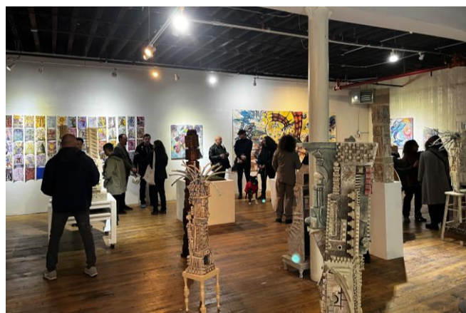
施設外観および内部施設の様子