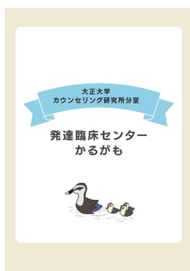
大正大学 「発達臨床センターかるがも」

本センター開設にあたり「地域の方々」や「発達臨床センターかるがもの事業に関心を持つ専門機関の方」に活動を知っていただくために、オープンディを開催いたします。