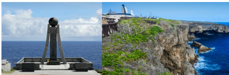
イメージ写真：万歳崖慰霊塔・バンザイクリフ万（歳崖風景）