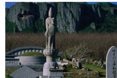
イメージ写真：サイパン平和観音

正式名のとおり、サイパンはアメリカ合衆国の自治領、国としてはサイパンを含む14の島から成る北マリアナ諸島に属します。